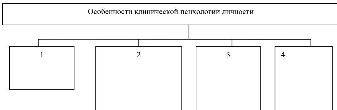
Рис. 1 Особенности клинической психологии личности

Если иллюстрации имеют наименование и пояснительные данные (подрисуночный текст), то слово «Рис.» и наименование помещают после пояснительных данных и располагают следующим образом: