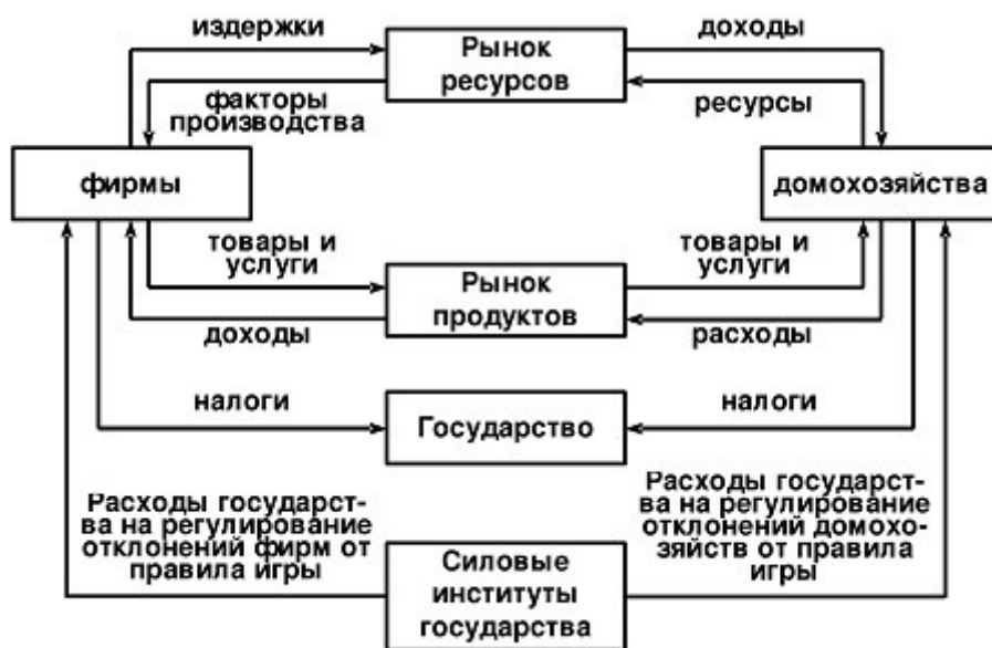
Схема 2. Кейнсианская модель ГРЭ: