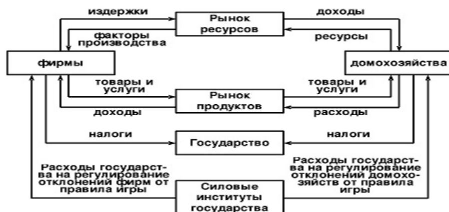
Схема 2. Кейнсианская модель ГРЭ: