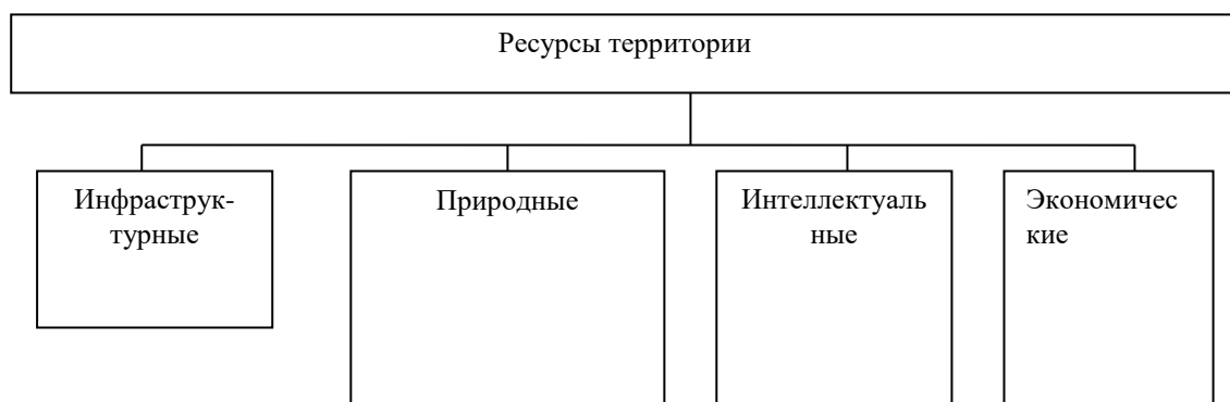
Рис. 1 Функциональная схема ресурсов территории

Если иллюстрации имеют наименование и пояснительные данные (подрисуночный текст), то слово «Рис.» и наименование помещают после пояснительных данных и располагают следующим образом: